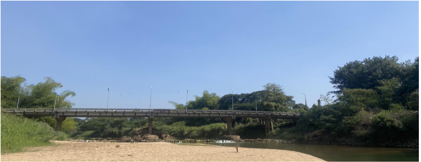
รูปตัดขวางลำน้ำ ปีน้ำ 2567 สถานี W.24 แม่น้ำวัง อ.สามเงา จ.ตาก